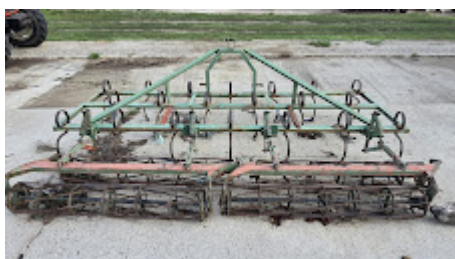
WhatsApp Image 2025-12-03 at 10.15.42.jpeg 541K