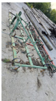
WhatsApp Image 2025-12-03 at 10.15.39.jpeg 335K